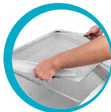
NOVO SISTEMA DE RETIRADA DE TAMPAS